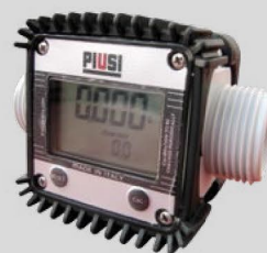
Przepływomierz cyfrowy K24

W przypadku chęci uzyskania dodatkowych informacji prosimy o kontakt: 605 551 030.