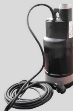
Pompa zasilana 230V AC