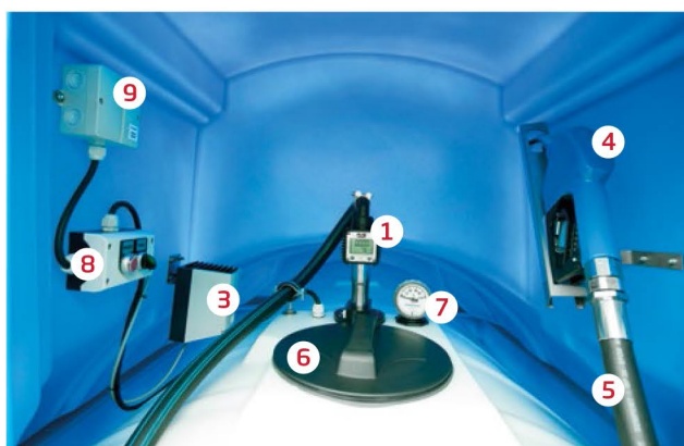
Wybrane elementy wyposażenia